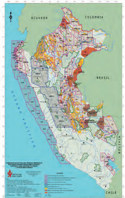
Mapa 1: Lotes de hidrocarburos en el Perú y la Amazonia peruana. Fuente: Instituto del Bien Común

convierte en un proceso que va destruyendo sus medios de vida y su cultura. Por ello, es necesario que el sistema de los derechos de propiedad del Estado reconozca jurídica y legalmente las perspectivas indígenas de la propiedad y la territorialidad indígena (espacios de uso, manejo y ocupación ancestral). Estudios realizados sobre la territorialidad indígena del pueblo Harakmbut por ejemplo, muestran la existencia de un derecho de tenencia autóctono, la propiedad indígena. Otorgar derechos de propiedad a los indígenas respetando sus perspectivas culturales sobre el medio natural abriría un proceso verdaderamente inclusivo que los dotaría de poder en las negociaciones gubernamentales de explotación y conservación de la Amazonia, socialmente justa y ambientalmente sustentable. Hacerlo, es factible recurriendo a la aplicación del derecho internacional sobre pueblos indígenas suscrito por el Estado peruano. Más específicamente aplicando las recientes “Directrices Voluntarias sobre la Gobernanza Responsable de la Tenencia de la Tierra, la Pesca y los Bosques en el Contexto de la Seguridad Alimentaria Nacional”, propuestas, aprobadas y ratificadas por el Comité de Seguridad Mundial Alimentaria y la FAO en la sesión del Foro Permanente para las Cuestiones Indígenas del 2012, que en su Capítulo IX recomiendan a los Estados el reconocimiento y protección de los derechos de propiedad autóctonos de los pueblos indígenas.