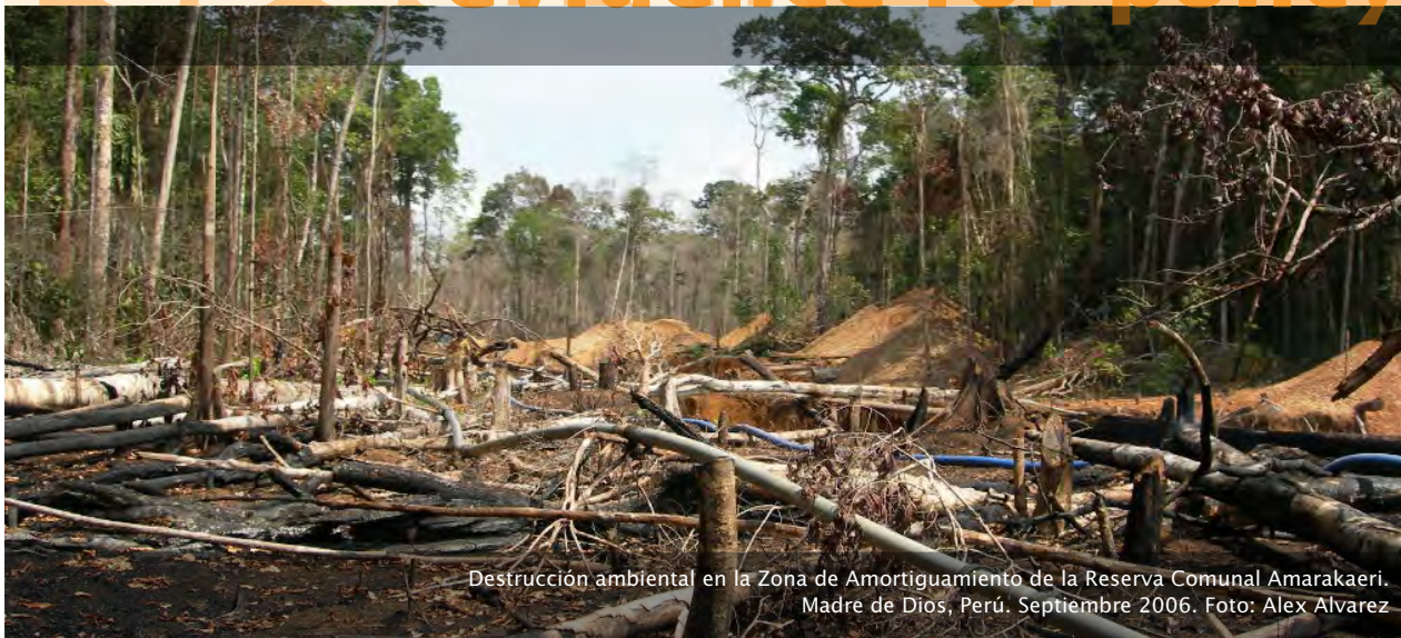
Destrucción ambiental en la Zona de Amortiguamiento de la Reserva Comunal Amarakaeri, Madre de Dios, Perú. Septiembre 2006.