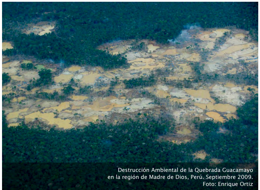
Destrucción Ambiental de la Quebrada Guacamayo en la región de Madre de Dios, Perú. Septiembre 2009.

El régimen de propiedad de los recursos naturales no debe fluir únicamente sobre principios de eficiencia económica, sino también bajo principios de equidad social y principios ecológicos, en términos de distribución, conservación y eficiencia energética. Para esto se requiere cambios relevantes en las normas del régimen de propiedad, como la aplicación de políticas públicas que busquen que el derecho de propiedad se ejerza de forma respetuosa con los principios de sustentabilidad ambiental. Esto se lograría articulando normas existentes, como las de Ordenamiento Territorial (OT) y de Zonificación Ecológica y Económica (ZEE), con normas de los derechos de propiedad de los recursos naturales, dándoles jerarquía equitativa a las de los derechos de propiedad. Si el régimen de propiedad es regulado desde la Constitución Política del Estado, entonces también debe primar el principio de la Declaración Universal de los Derechos Humanos que establece que 'toda persona tiene derecho a la propiedad individual o colectiva'.