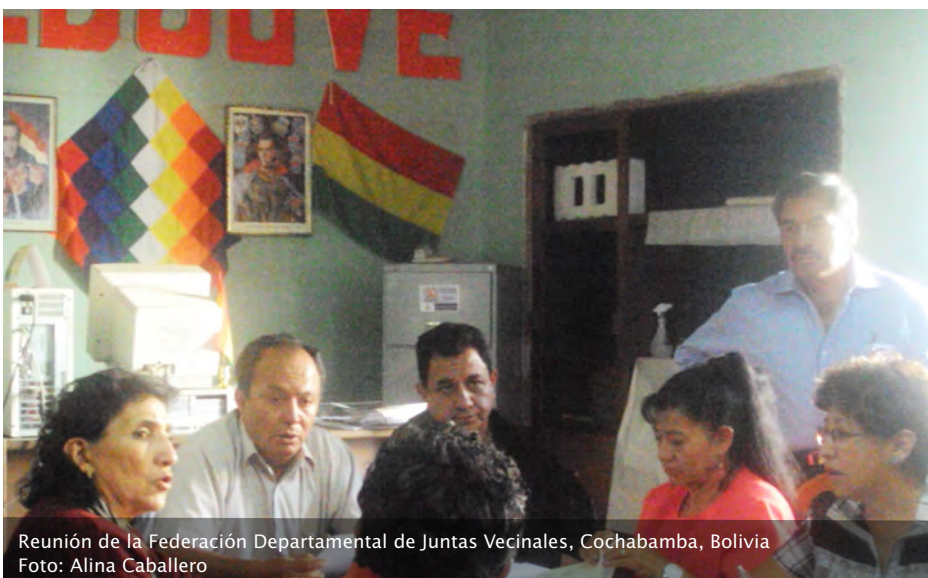
Reunión de la Federación Departamental de Juntas Vecinales, Cochabamba, Bolivia

Estas redes deberían ser impulsadas por miembros de las organizaciones de la sociedad civil, entre ellas la Universidad en coordinación con personeros de ONG's vinculados con la problemática, involucrando en sus acciones a responsables de las entidades estatales encargadas de la gestión a nivel departamental y municipal. Ello permitiría no sólo integrar las acciones realizadas en este campo incorporando a los diversos agentes sociales en las