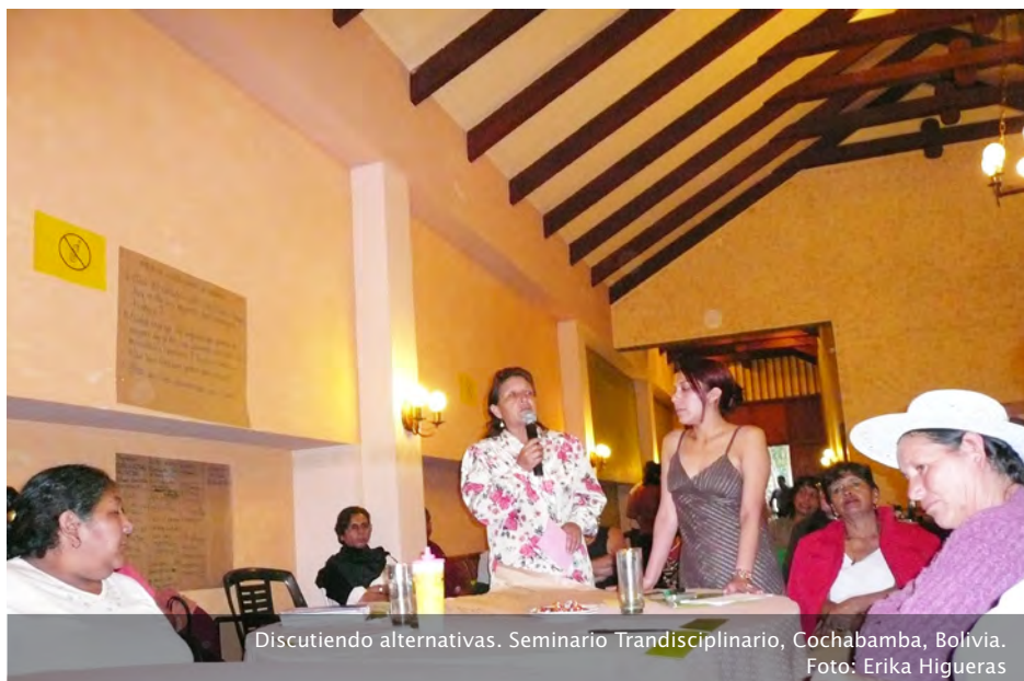
Discutiendo alternativas. Seminario Transdisciplinario, Cochabamba, Bolivia.

Las funciones de estas redes deberían asumir dos facetas: por un lado, realizar un trabajo con la misma ciudadanía, para lo cual las OTB's se presentan como espacios privilegiados aunque no únicos, donde se pongan en pie procesos de información y capacitación sobre derechos y obligaciones ciudadanas. Por otro lado, impulsar campañas de presión y publicidad para que autoridades gubernamentales a nivel municipal y departamental, reconozcan la importancia real de la participación ciudadana de las mujeres, abriéndose hacia una creciente gestión transparente que permita no sólo un mayor acceso e intercambio de las mujeres con estas instancias y entre ellas, sino el desarrollo de un trabajo integral, coordinado y conjunto, capaz de aprovechar al máximo las potencialidades que presenta la agencia ciudadana de las mujeres para la construcción de un vivir bien sustentable a nivel urbano.