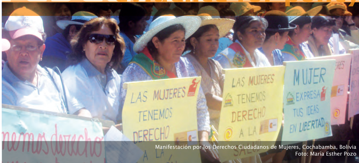
Manifestación por los Derechos Ciudadanos de Mujeres, Cochabamba, Bolivia