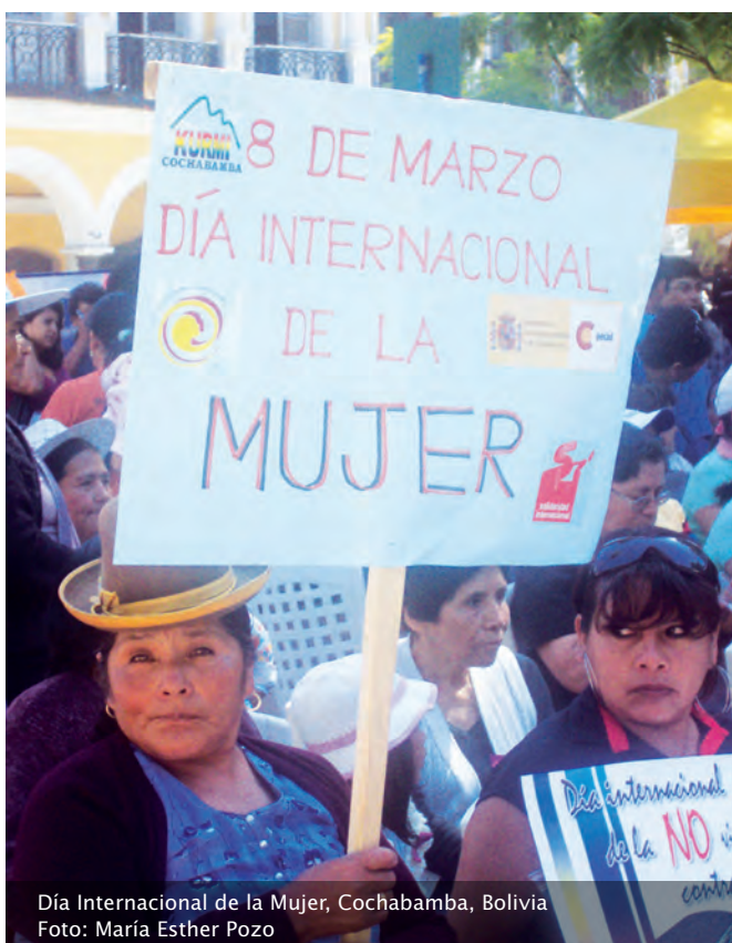
Día Internacional de la Mujer, Cochabamba, Bolivia